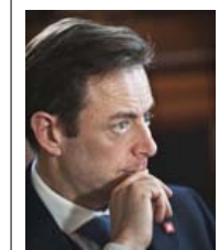
Bart De Wever.

Een gebruikersruimte voor drugsgebruikers zal er in Antwerpen de volgende jaren niet komen. “Er zullen ongetwijfeld een aantal goede argumenten zijn in het voordeel van zo'n ruimte. Maar er zijn ook heel veel argumenten om het niet te doen. En die geven de doorslag”, zegt burgemeester Bart De Wever (N-VA). “Met het drugsbeleid dat we nu voeren zou het nogal vreemd zijn om op één of meerdere locaties in de stad een gedoogbeleid te gaan voeren voor harddrugs. Want dat is uiteindelijk wat je doet door een gebruikersruimte te installeren. Je creëert een plek waar mensen vrij drugs kunnen gebruiken. Bovendien trek je met een gebruikersruimte ook allerhande ongewenste nevenactiviteiten aan.”